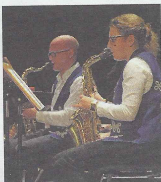
Die „Blauen Husaren“ übernahmen die musikalische Umrahmung.

Der Sport verbindet, so Gummer. Deshalb leisten die Vereine einen wichtigen Beitrag für die Gesellschaft, die Sportler seien auch „Botschafter Hockenheims“. Die Bedeutung des Sports lasse sich mit den Worten „Bewegung, Begegnung, Brücken bauen“ umschreiben, sagte Gummer. Menschen, die aus anderen Ländern kommen, hätten durch die Vereine die Möglichkeit, mit den Einheimischen in Kontakt zu kommen, sich auszutauschen und Freizeit gemeinsam zu gestalten. Auch die Integration von Menschen mit Behinderungen durch die Vereine lobte Gummer ausdrücklich. Bevor der Startschuss für den Verleihungs-Marathon durch Dieter Gummer startete, präsentierte sich der Nachwuchs der DJK in Person der Mädchen der Turngruppe-Leistungsgruppe. Die Mädchen sprangen mit Anlauf auf der Bühne auf ein Trampolin und vollführten in der Luft beeindruckende Figuren wie einen Salto. Der verdien-